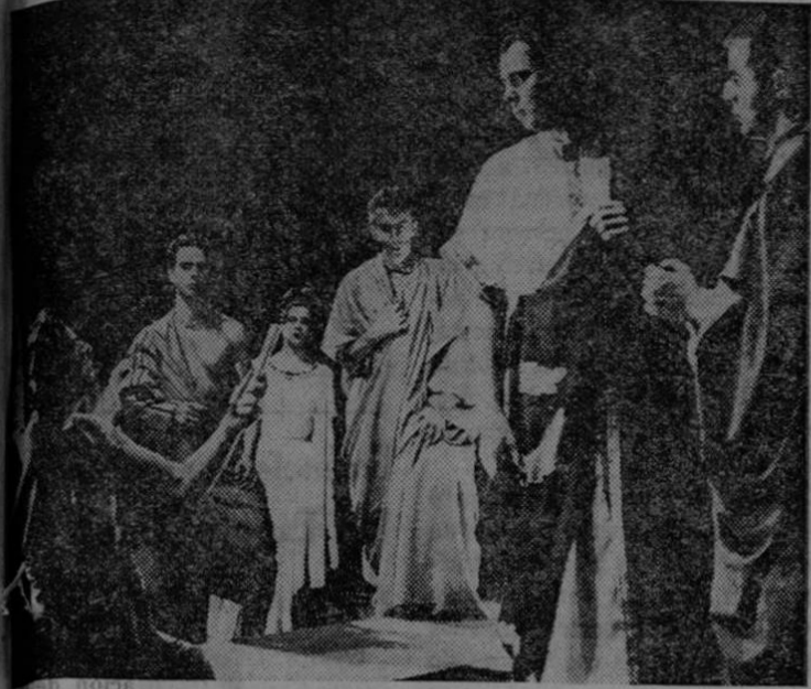
Escena de "Julio César", de Shakespeare, representada por alumnos de la Escuela de Declamación de la Universidad Católica de Washington que forman parte de la compañía Players Incorporated, que hace poco tiempo actuó en 200 poblaciones de los Estados Unidos y el Canadá.