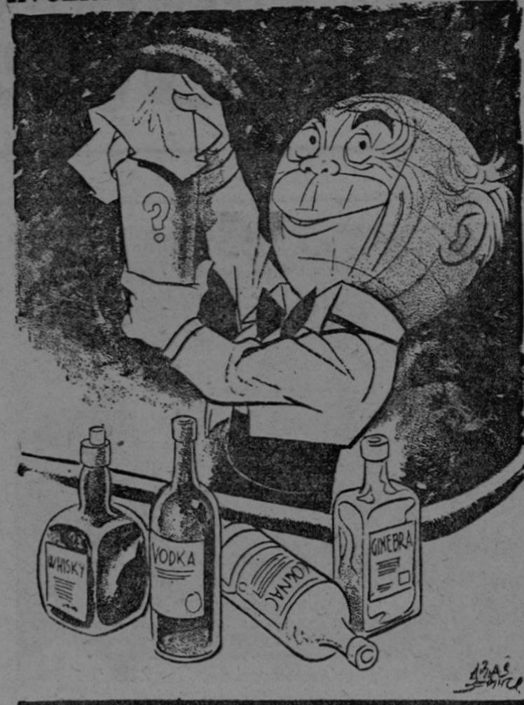
—A ver qué sale... De "EXCELSIOR", de la ciudad de México.