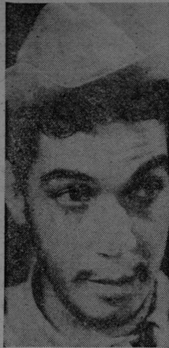
Mario Moreno, "Cantinflas"

CIUDAD DE MEXICO.—La fama de Mario Moreno "Cantinflas" en el extranjero se ha visto acrecentada recientemente con motivo del gran programa de televisión que en los Estados Unidos lleva por título: "Ancho, Ancho Mundo"